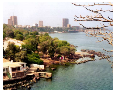
Panorámica de Dakar

La ciudad de Dakar, capital de Senegal, está situada en el extremo occidental de África. Cuenta con una población de 1.001.468 habitantes y cubre un área de 547 km 2 . Es el centro político, económico y cultural del país. La situación de Dakar da al puerto un rol privilegiado en la intersección de las rutas marítimas entre Europa, África y América del Sur.