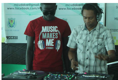
Creatividad y formación en la MCU