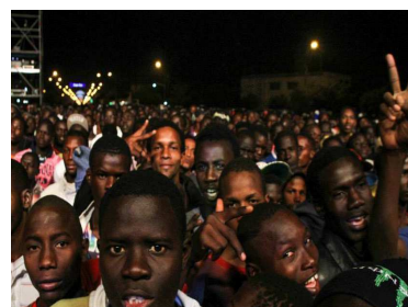
Jóvenes disfrutando de una noche de conciertos

Los jóvenes comprueban que pueden hacer de su pasión una profesión, que pueden trabajar viviendo de su arte, al cual lo consideraban hasta ahora solo como una afición. Hasta la fecha, cerca de 500 jóvenes se han beneficiado de las acciones formativas de la MCU.