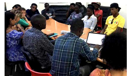
Diversas actividades de la Casa de las Culturas Urbanas.