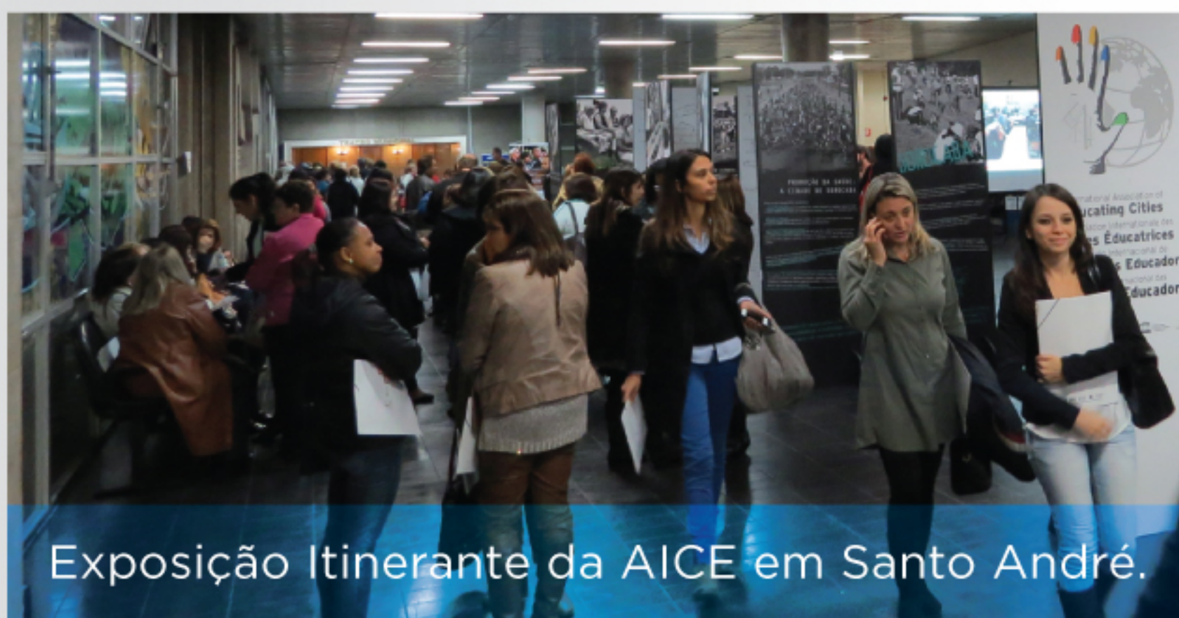
Exposição Itinerante da AICE em Santo André.

Hoje a Associação Internacional de Cidades Educadoras (AICE) reúne mais de 470 cidades em 37 países com o objetivo de trocar experiências, cooperar e avançar para o desenvolvimento e implementação de práticas inspiradas nos Princípios da Carta das Cidades Educadoras.