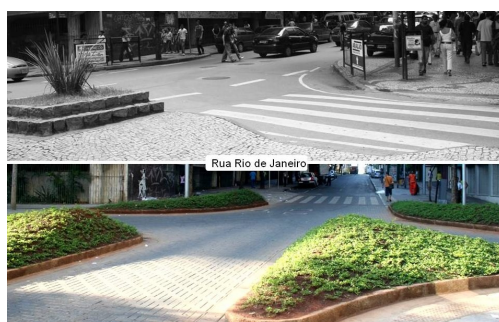
Calle de Río de Janeiro