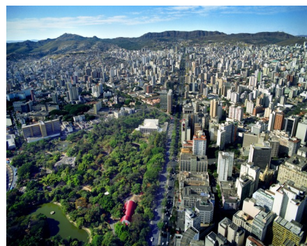
Vista Aérea de Belo Horizonte

Pueden consultar más de 1.000 experiencias educadoras en la página web del Banco Internacional de Documentos de Ciudades Educadoras (BIDCE):