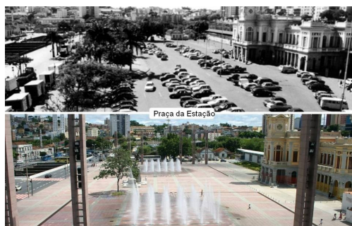
Plaza de la Estação

En este contexto, en el año 2002 se lanzó el programa " Caminos en la Ciudad ", de recuperación de espacios públicos del centro de la ciudad que consiste en la creación de una red de calles libres de barreras, seguras y confortables para los peatones, conectadas con el transporte público. El programa, que cuenta con una amplia participación ciudadana, se propone transformar el centro de la ciudad en un lugar más atractivo y accesible para los ciudadanos, mejorando sus condiciones urbanísticas y de habitabilidad y promoviendo, a la vez, su desarrollo social, cultural y económico.