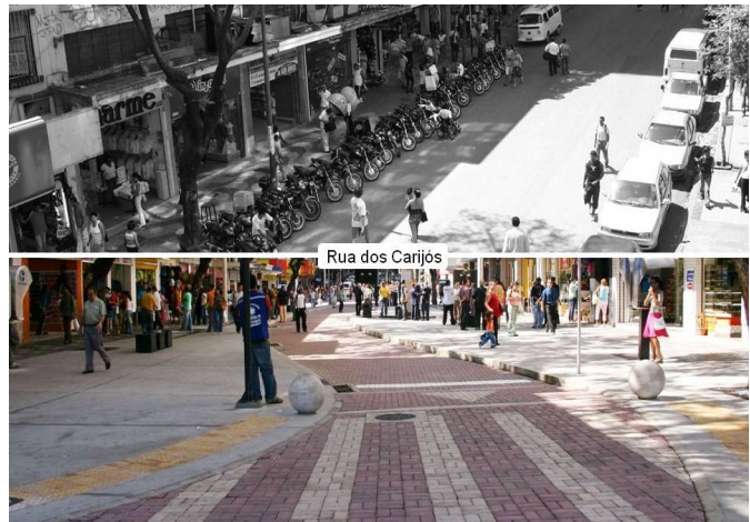
Calle de los Carijós

Los objetivos de "Caminos en la Ciudad" fueron incorporados al plan director del centro de la ciudad y al plan de movilidad. En esta etapa, los proyectos de recualificación urbanística siguieron las siguientes directrices: ordenación del tránsito de vehículos, mejorando la eficiencia del transporte colectivo; implementación de ciclovías (carriles bici) y rutas de peatones; creación de políticas de