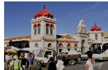
Mercado de Loulé