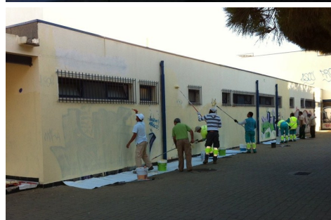
Voluntarios pintando un edificio público