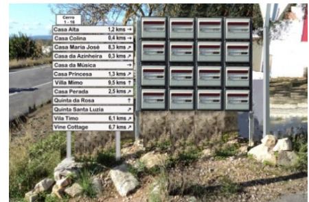
Estandarización de la señalización