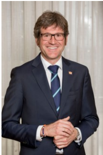
D. Gorka Urtaran Agirre. Alcalde de Vitoria-Gasteiz

Como Alcalde de Vitoria-Gasteiz e Concelleira de Educación e Cultura, queremos agradecervos a confianza depositada na nosa cidade para coordinar a Rede Estatal de Cidades Educadoras (RECE) durante o presente período.