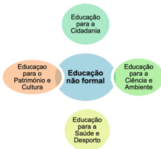
Figura 1: Áreas de intervenção do Projeto Educativo Local

As propostas apresentadas inscrevem-se em cada um dos eixos definidos para Évora, uma Cidade Educadora e nas quatro áreas de intervenção do PEL, conforme evidenciado na figura 1. ■