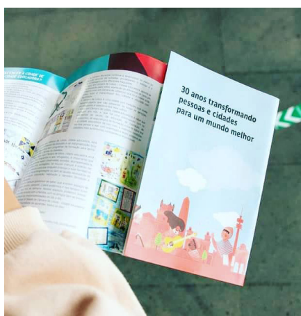
Camara de Lobos