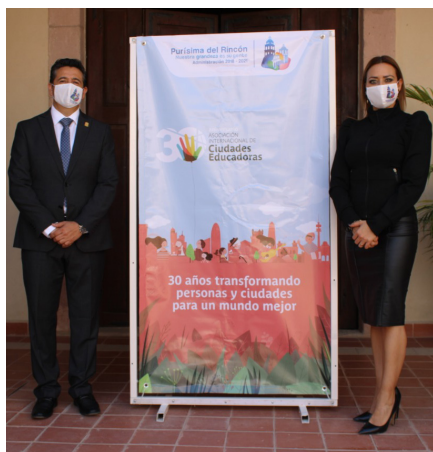
Purísima del Rincón