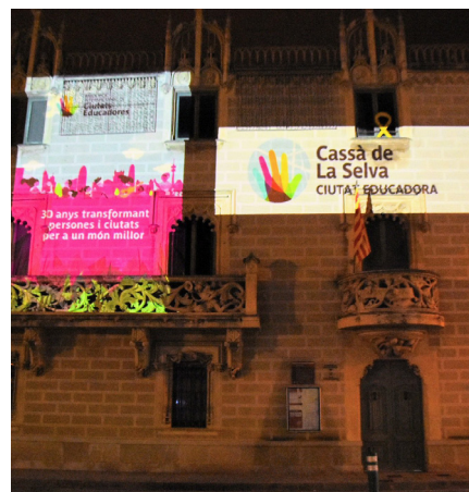
Cassà de la Selva