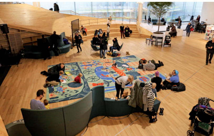
Dans le centre-ville d'Helsinki, les espaces réservés aux familles étaient particulièrement rares. Depuis l'ouverture de la nouvelle Bibliothèque centrale d'Oodi en décembre 2018, les familles représentent l'un des groupes d'usagers les plus motivés.