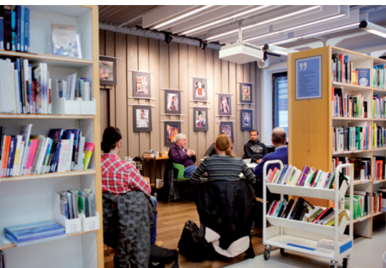
Au printemps 2019, les bibliothèques d'Helsinki ont organisé 14 cafés linguistiques hebdomadaires, auxquels des centaines d'immigrants souhaitant apprendre le finnois ont participé.