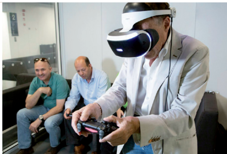
La Bibliothèque Oodi dispose de salles de jeux vidéo et de salles multimédia.

à bras ouverts ce nouvel espace impressionnant. Il est très rare qu'un nouveau bâtiment public si coûteux ait reçu des applaudissements aussi unanimes.