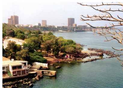
Vue de Dakar ©Isidore BOULLU

La ville de Dakar, capitale du Sénégal, est située à l'extrémité occidentale de l'Afrique. Elle a une population de 1 001 468 habitants et couvre une zone de 547 km 2 . C'est le centre politique, économique et culturel du pays. La situation de Dakar donne au port un rôle privilégié à l'intersection des routes maritimes entre l'Europe, l'Afrique et l'Amérique du Sud.