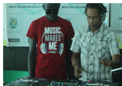
Créativité et formation à la MCU