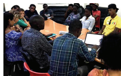
Activités de la Maison des Cultures Urbaines