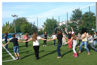
D'autres activités ludiques associées à l'initiative