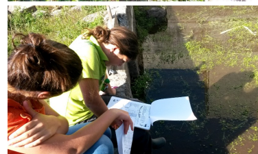
Des bénévoles en réalisant des tâches dans les rives

La Mairie de Braga a proposé à des écoles, des collèges et des lycées, des ONG, des entreprises et la population en général de former des groupes disposés à adopter des tronçons de la rivière Este, à son passage dans la municipalité. Cela a permis de mobiliser des centaines de bénévoles. Les participants effectuent le nettoyage de la rivière et de ses berges, et inspectent la qualité de l'eau. L'adhésion au projet a été un succès et n'a pas cessé de croître depuis son démarrage.