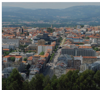
Vue panoramique de Braga