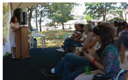
Agenda d'activités diversifié dans les cimetières