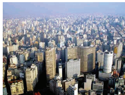
Vue de São Paulo

La ville de São Paulo, chef-lieu de la province du même nom, est le principal centre financier, entrepreneurial et commercial de l'Amérique latine. C'est la plus grande ville du Brésil, et elle compte 12 038 175 habitants selon les données de l'Institut brésilien de Géographie et des Statistiques (2016).