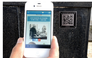
Codes QR installés sur les tombes

En janvier 2015, 150 codes QR ont été installés sur les tombes d'importance historico-artistique du cimetière de Consolação. Grâce à cet outil, on a mis à la disposition des visiteurs des photos, des vidéos ainsi que des textes sur la vie des personnes célèbres qui sont enterrées dans ce cimetière, afin de renforcer son caractère muséal. On a aussi créé un itinéraire autoguidé pour que les visiteurs acquièrent des connaissances quant à ces personnages, en plus des travaux artistiques qui se trouvent dans les tombes. D'autres cimetières ont aussi incorporé les codes QR dans leurs itinéraires.