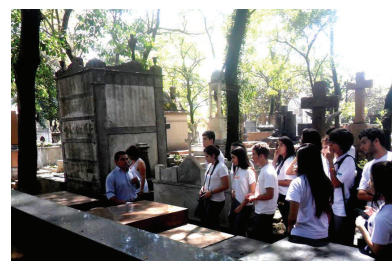
Visites adressées au public scolaire

En mars 2015, l'atelier « Salles élargies » a été mis en route dans le cimetière de Consolação, destiné à la formation des enseignants. Il constitue le résultat de l'effort conjoint du Service funéraire et de la Direction de l'Enseignement du district d'Ipiranga, afin de promouvoir les cimetières comme autant d'espaces interdisciplinaires de développement des connaissances. Parmi celles-ci, interviennent l'art, l'histoire, la culture, l'environnement, etc. Du fait du succès de cette activité, de nombreuses écoles ont demandé de faire des visites au cimetière, et c'est la raison pour laquelle on a décidé que le mercredi serait consacré aux visites du public scolaire.