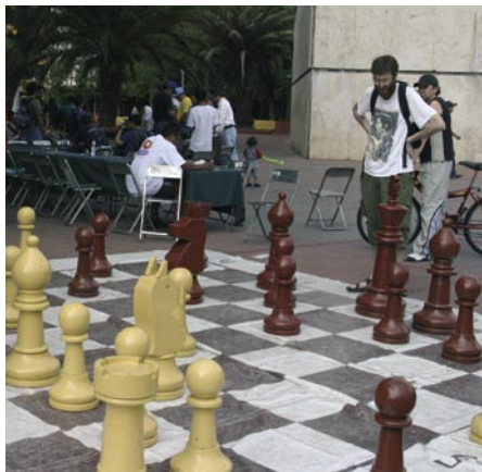
Activités ludiques à l'air libre