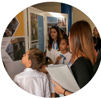
Câmara de Lobos

Acte públic en què el govern local fa visible i agraeix públicament el treball en favor de l'educació a la ciutat de persones i/o entitats.