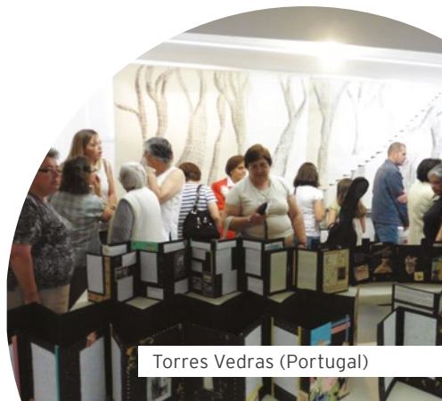
Torres Vedras (Portugal)