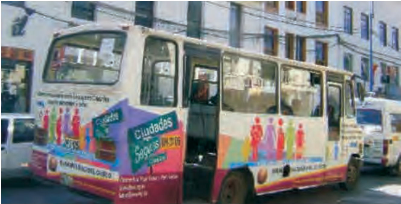
Programa Ciutats sense Violència envers les Dones, Ciutats Segures per a Tothom. Rosario, Argentina

actualment la ciutat, en què una part important de la població ha estat marginada de la producció o ha d'acceptar unes relacions laborals flexibilitzades i inestables de resultes de les polítiques neoliberals. Resumint, Harvey planteja el protagonisme d'una nova categoria: els precaritzats urbans . A aquesta lectura caldria incorporar-hi les persones que participen en la reproducció de la vida, "les cuidadores per excel·lència" de la infància, dels malalts, de la gent gran; les persones que vetllen per la vida en les grans comunitats de pobresa de la regió; les persones que participen, per tant, en la reproducció de la vida quotidiana: les dones.