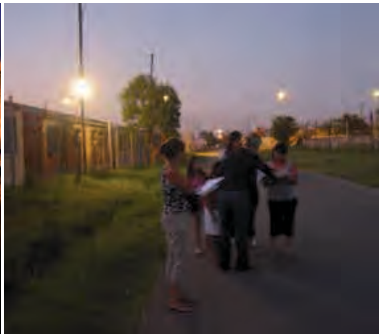
Passejada nocturna per a detectar zones insegures. Programa Ciutats sense Violència envers les Dones, Ciutats Segures per a Tothom. Rosario, Argentina