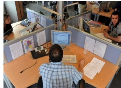
25 operadores responden a las demandas de los ciudadanos

La Oficina de la Tranquilidad va dirigida a todos los ciudadanos que deben hacer frente a un problema que altera la tranquilidad.