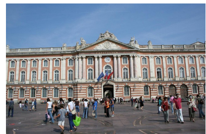
El Capitole de Toulouse