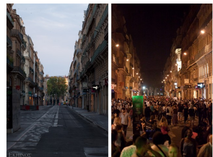
El contraste entre el día y la noche en las calles de Toulouse