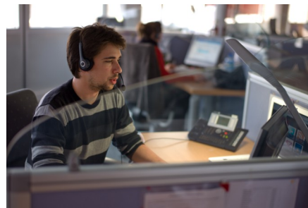
Más de 500.000 llamadas han sido atendidas en 2 años

Uno de los motivos principales que se tuvo en cuenta en la decisión de implementar esta iniciativa fue que la Policía Nacional, a través del número 17, recibía llamadas de ciudadanos presentando situaciones que no eran urgentes, además de que este número estaba frecuentemente colapsado. Los operadores del servicio telefónico de la Policía Nacional sólo pueden dedicar un tiempo mínimo de escucha, puesto que deben dar curso a las demandas más urgentes. La Oficina de la Tranquilidad permite dar respuesta a esta demanda social.