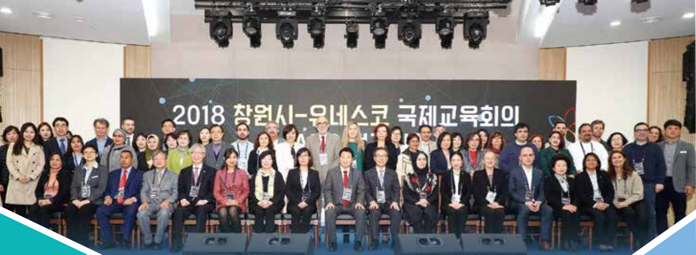
국제교육도시연합(IAEC) 아시아 태평양 네트워크