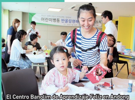
El Centro Banolim de Aprendizaje Feliz en Andong

El Centro Banolim de Aprendizaje Feliz tiene por objetivo lograr un mayor acceso de los ciudadanos al aprendizaje sin importar su edad, clase social ni la comunidad a la que pertenecen. En este sentido, el gobierno central y los locales colaboran para desarrollar un sistema íntegro de educación continua de los ciudadanos, con miras a permitir a cualquier persona aprender en su propia comunidad. Mucha atención está siendo prestada a este proyecto, ya que sirve como un nuevo modelo de educación.