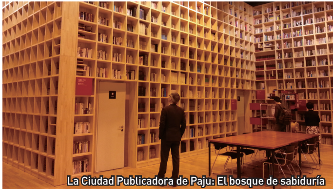
La Ciudad Publicadora de Paju: El bosque de sabiduría

El pasado 23 de julio de 2014, 16 guías fueron contratados para ofrecer sus servicios en idiomas extranjeros a los visitantes extranjeros en la Ciudad Publicadora de Paju.