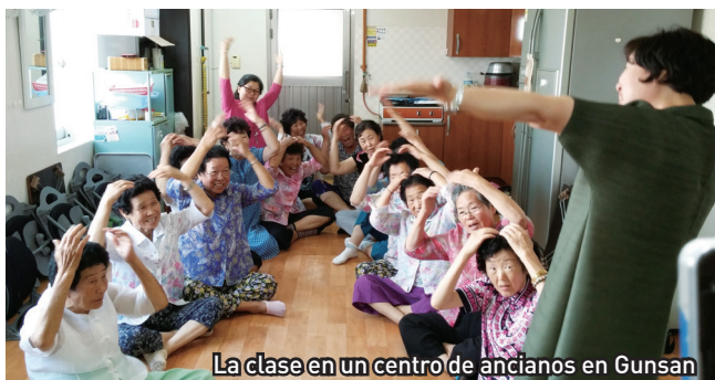
La clase en un centro de ancianos en Gunsan