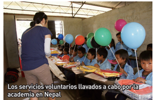
Los servicios voluntarios llevados a cabo por la academia en Nepal

En esta línea, en 2014, 24 voluntarias viajaron a Nepal visitando 3 escuelas proporcionando asistencia material, donación de talentos y servicios en la cafetería.