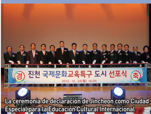
La ceremonia de declaración de Jincheon como Ciudad Especial para la Educación Cultural Internacional