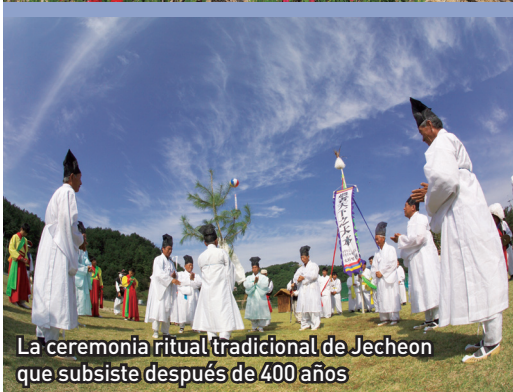
La ceremonia ritual tradicional de Jecheon que subsiste después de 400 años