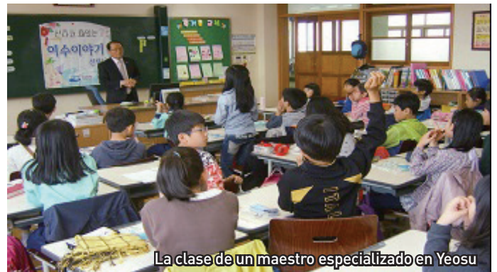
La clase de un maestro especializado en Yeosu

Los maestros especialistas en Yeosu fueron elegidos en un proceso de selección después de formarse en 'el Curso de Formación de los Maestros Especialistas en Yeosu', organizado por la ciudad y financiado por el Ministerio de Educación de Corea en 2012. Estos mismos maestros, durante 4 meses, formaron parte tanto en la formulación del currículo adaptado al nivel de los estudiantes primarios de 3 o 4º grado, como en los estudios de pedagogía efectiva. El currículo desarrollado a través de un proceso de prueba aplicado en 30 clases piloto y 5 clases de evaluación, y posteriormente fue modificado y complementado.