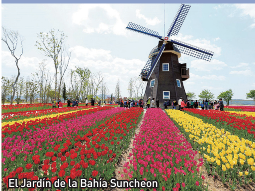
El Jardín de la Bahía Suncheon