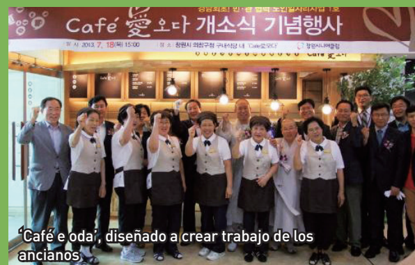
'Café e oda', diseñado a crear trabajo de los ancianos