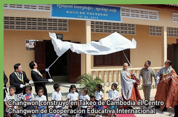
Changwon construyó en Takeo de Cambodia el Centro Changwon de Cooperación Educativa Internacional