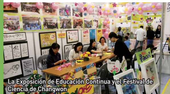
La Exposición de Educación Continua y el Festival de Ciencia de Changwon