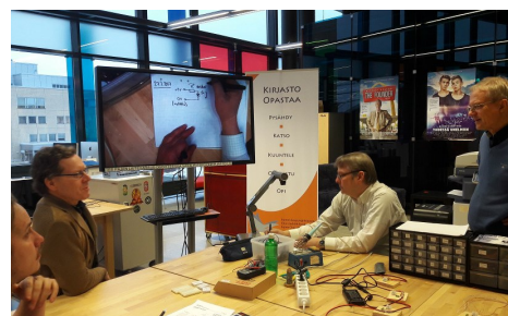
Colaborando y compartiendo conocimientos