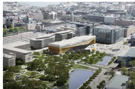
Panorámica de Espoo

Es la segunda ciudad más grande y de mayor crecimiento de Finlandia, formada por una sociedad cada vez más próspera y un desarrollo moderno en un área metropolitana en expansión, bien conectada y de proyección internacional.