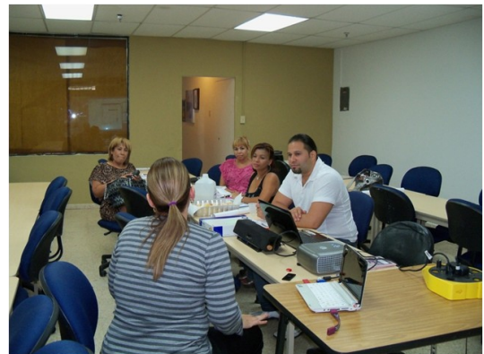
Formación sobre prevención de violencia doméstica