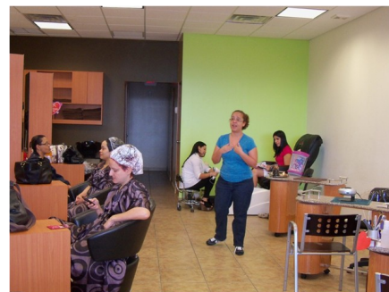
Actuación de una monologuista

Esta iniciativa va dirigida a la prevención y atención de la violencia doméstica en mujeres desde los 15 años de edad, residentes en la ciudad de Caguas.