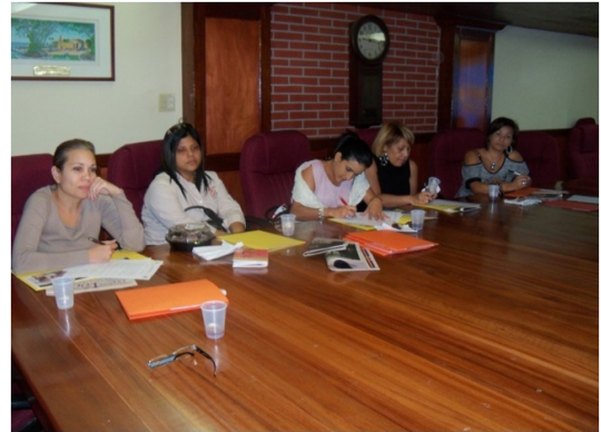
Presentación del proyecto a los propietarios/as de los salones de belleza

En los salones de belleza se pueden realizar diferentes actividades de sensibilización. El formato de cada actividad se determina mediante una visita al salón por parte del personal del proyecto y de acuerdo con la persona administradora o propietaria. También se evalúa si se han producido situaciones de violencia doméstica en el salón, a fin de considerar las aspectos a fortalecer mediante talleres e intervenciones educativas.