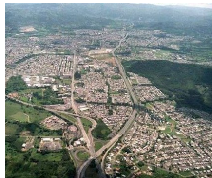
Visión aérea de Caguas