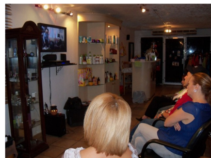
Sesión de cine foro en uno de los establecimientos participantes