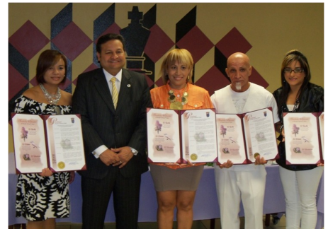
El Alcalde de Caguas, Hon. William Miranda Torres, entregando diplomas a los propietarios de los salones de belleza participantes en la 1ª edición del Proyecto

A partir de estos datos, se diseñó junto con las PYMES un proyecto de intervención socioeducativa que se lleva a cabo mientras las clientas reciben algún servicio de cuidado estético.