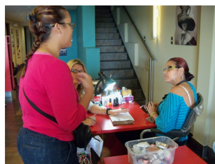
Conversaciones sobre violencia doméstica en un salón de belleza