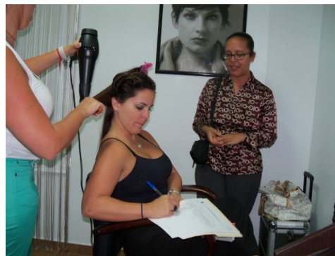
Clienta contestando una encuesta