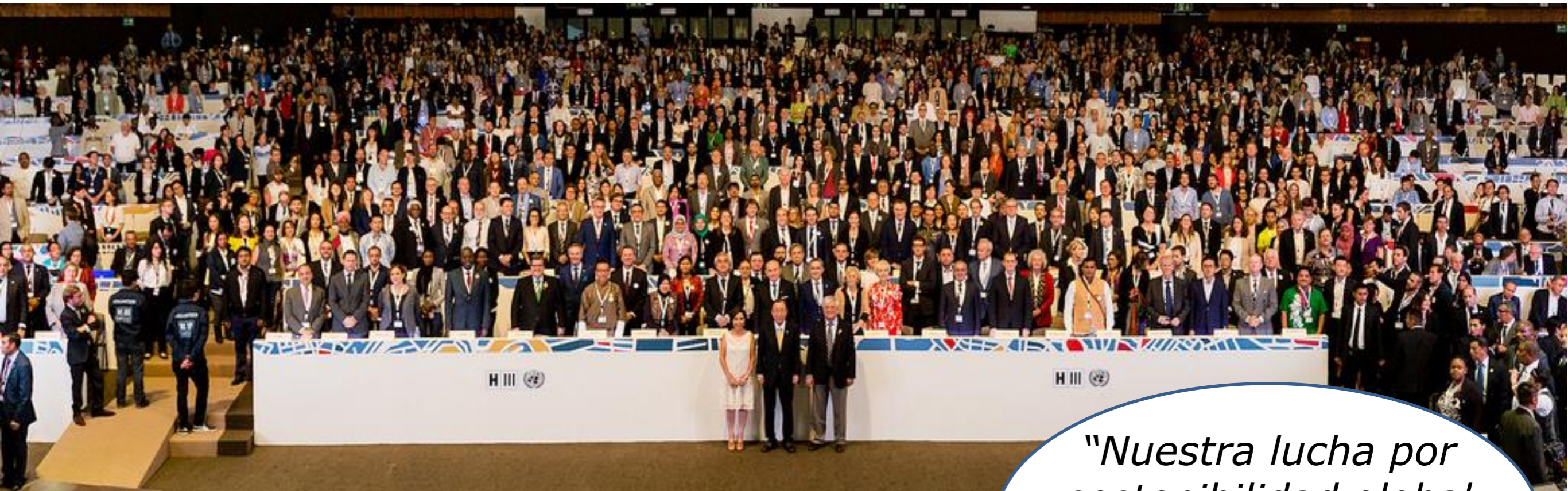
Ban Ki-moon Ex-Secretario General de la ONU

"Nuestra lucha por sostenibilidad global se ganará o perderá en los ciudades"