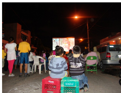
Cinéma en plein air de nuit

b) « Cinéma en plein air »: projection de films sur écran géant dans les espaces publics des quartiers participants. Afin de susciter une rencontre intergénérationnelle, les films sélectionnés s'adressent à tous les publics et transmettent des valeurs familiales.