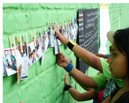
Atelier de sensibilisation

Le principal projet d'avenir est que cette initiative soit accueillie et adoptée par d'autres organisations de la société civile avec l'objectif d'amplifier ses répercussions et de garantir sa continuité. L'intention est d'établir une forte alliance avec l'initiative privée, les médias et les universités; une des clauses de cette alliance devra sans aucun doute être la récupération des espaces publics des quartiers.