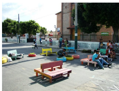
Nouveaux usages des rues

e) « Parcs libres »: parcs thématiques et itinérants. Il est procédé à la détection des espaces en état d'abandon appartenant à la municipalité, afin de les transformer avec l'aide et la collaboration de leurs voisins, et de les convertir en espaces conçus par les habitants. Les activités sont conçues pour chaque pâté de maisons, par exemple, il est réalisé dans une rue des activités pour les enfants destinées à promouvoir et à sauver les traditions mexicaines : jeux traditionnels tels que la marelle, la loterie, etc., dans une autre rue ont lieu des activités destinées aux adultes : bal, travaux manuels, échanges de professions, etc., et dans une troisième rue des activités pour les jeunes : tournois sportifs, art urbain ou concours de graffitis, concours de fanfares musicales, etc.