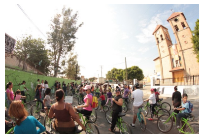
Parcours de connaissance d'un quartier à vélo

L'espace public remplit dans les communautés une fonction de cohésion sociale, de communication et de tolérance. Cependant, dans plusieurs zones de la ville, ces espaces se sont détériorés en raison de différentes problématiques sociales, telles que l'insécurité, la violence, le trafic des stupéfiants ou la consommation de drogues, etc.