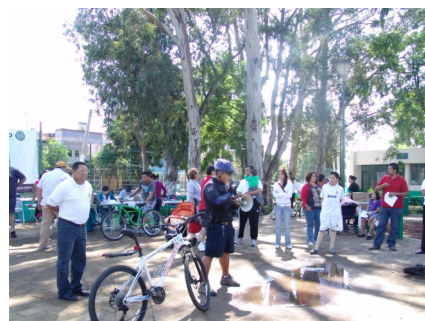
La citoyenneté participe aux activités du projet