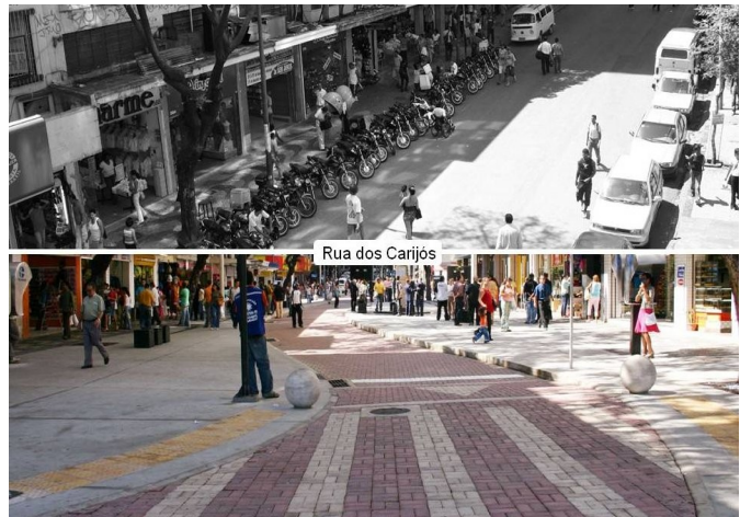
Calle de los Carijós

Los objetivos de "Caminos en la Ciudad" fueron incorporados al plan director del centro de la ciudad y al plan de movilidad. En esta etapa, los proyectos de recualificación urbanística siguieron las siguientes directrices: ordenación del tránsito de vehículos, mejorando la eficiencia del transporte colectivo; implementación de ciclovías (carriles bici) y rutas de peatones; creación de políticas de