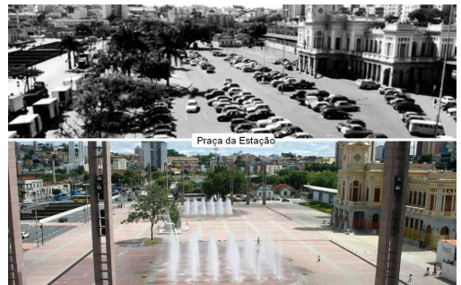
Plaza de la Estação

En este contexto, en el año 2002 se lanzó el programa " Caminos en la Ciudad ", de recuperación de espacios públicos del centro de la ciudad que consiste en la creación de una red de calles libres de barreras, seguras y confortables para los peatones, conectadas con el transporte público. El programa, que cuenta con una amplia participación ciudadana, se propone transformar el centro de la ciudad en un lugar más atractivo y accesible para los ciudadanos, mejorando sus condiciones urbanísticas y de habitabilidad y promoviendo, a la vez, su desarrollo social, cultural y económico.