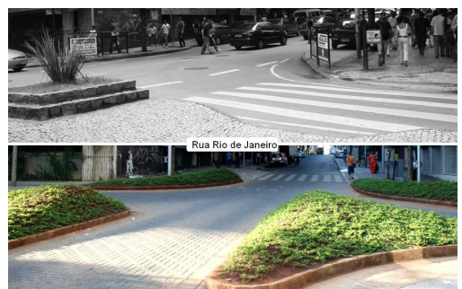
Calle de Río de Janeiro